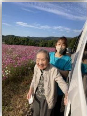
青空とコスモスと私

ドライブにて、大川町山口区のふれあい広場のコスモス園と、大川内山へ紅葉狩りへ行って来ました。そして拾ってきた落葉で壁紙作成!! いや~芸術の秋ですね👍