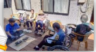
真面目に焼いてます