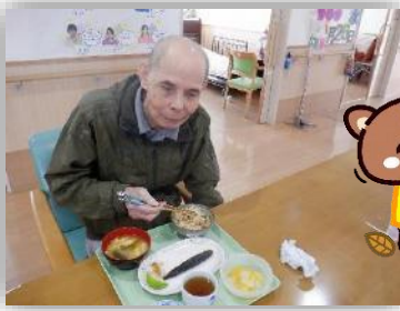
骨も無いので安心!!