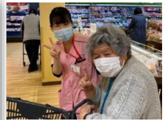
お買い物ドライブ。喜ばれている利用者様