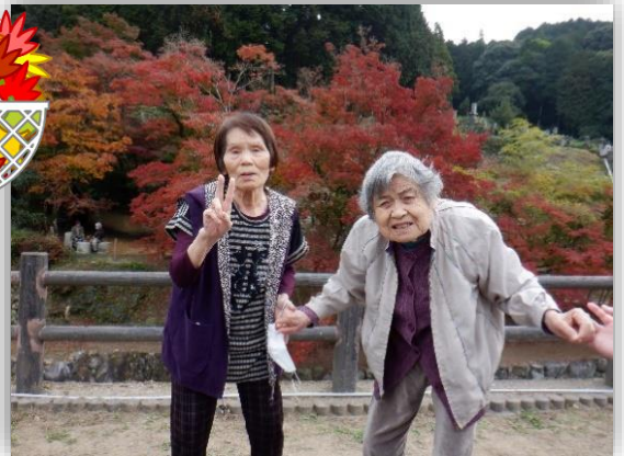
紅葉も綺麗かばってんわたいども