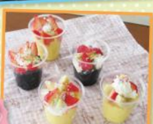
美味しそうなおパフェ