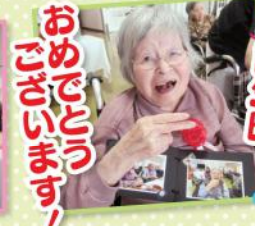
おめでとうございます!