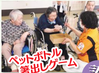
ペットボトル箸出しゲーム