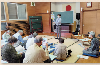
(11.10) 桑木原老人クラブ様