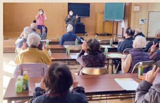
(11.28) 原明老人クラブ様