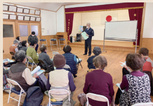
(11.27) 立部にこここサロン様

出前講座の様子はホームページ・謙仁会Facebookで紹介しています。是非ご覧ください!!